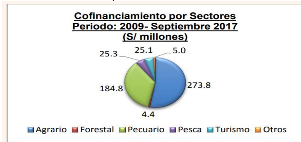
Gráfico 01 Cofinanciamiento de Propuestas Productivas ganadoras en procesos concursables